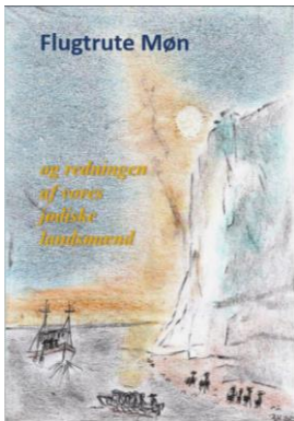
Bogen Flugtrute Møn

Hvert skolebibliotek i Vordingborg kommune er tildelt 3 frieksemplarer til udlån.