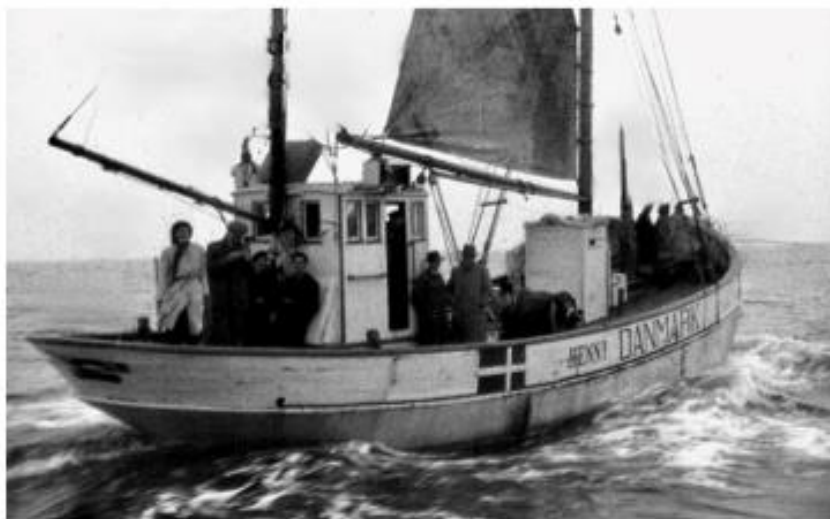
Over 7000 jøder flygtede fra Danmark med robåde, kajaker, fiskerbåde mv.