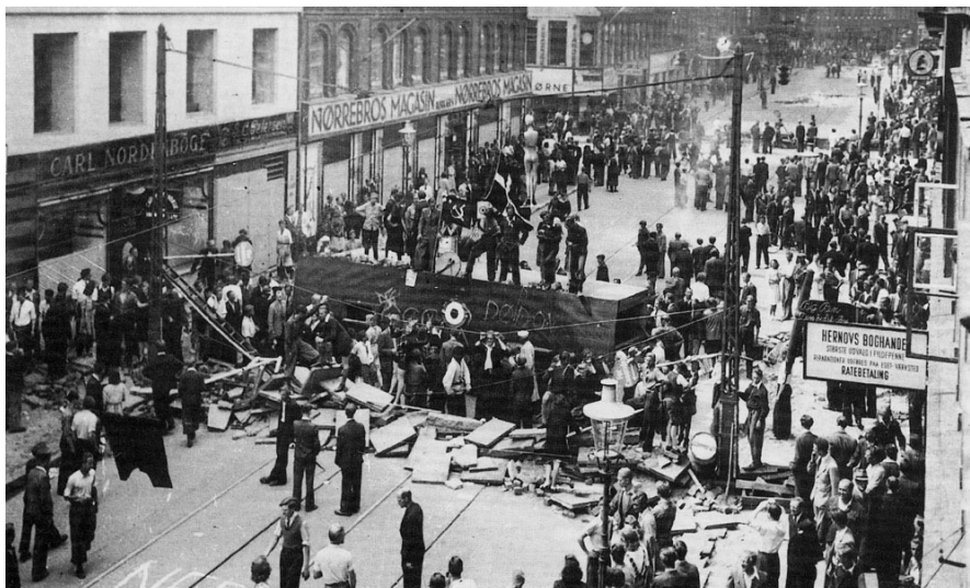
Folkestrejken på Nørrebro i København, august 1943

Det ville den danske regering ikke gå med til. Så indførte tyskerne militær undtagelsestilstand.