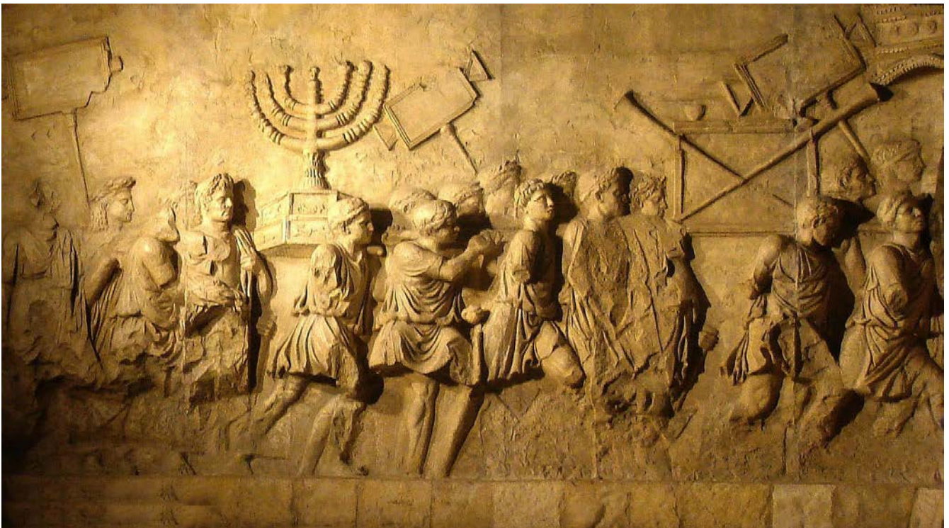
Romersk sejrsoptog i Rom efter ødelæggelsen af Templet i Jerusalem

Nogle steder levede jøderne et par hundrede år i fred. Men når krige brød ud, eller pest eller andre ulykker ramte landet, fik de skylden. De blev syndebukke, dvs. ofre for noget de ingen skyld havde i. Så blev synagogen sat i brand og jødekvartret plyndret. Jøderne blev mishandlet eller dræbt, og de overlevende flygtede til et mere sikkert sted, hvor livet langsomt kom i gang igen. Så skete det samme på ny.