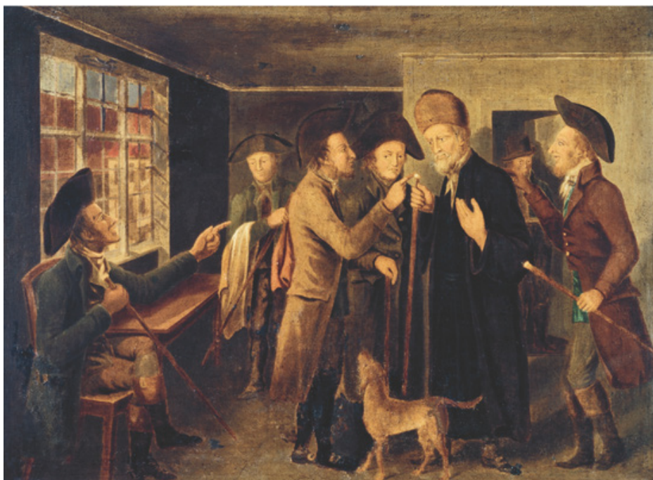
Dansk jøde i 1700

Først i 1788 kunne jøder komme ind i håndværkerlaugene. Og i 1814 blev de ligestillet med andre danske borgere.