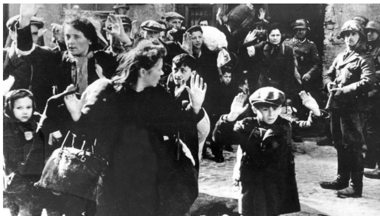
Ghettoen i Warszawa

Nu blev ghettoer og opsamlingslejre tømt. Tog efter tog rullede fra alle dele af Europa til Polen. I de fleste lande vendte folk ryggen til. Nogle lande ville gerne af med jøderne og indbyggerne deltog i drabene. Enkelte lande protesterede imod, at deres jødiske borgere blev forfulgt, men vovede i øvrigt ikke at sætte sig op imod tyskerne.