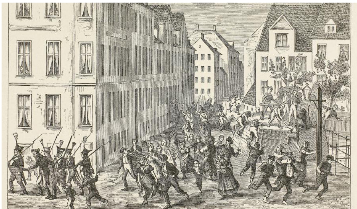
Jødefejden i København 1819

Ved folketællingen i 1901 var jødernes antal i stærk tilbagegang. Omkring 1/3 var gift med kristne, og deres børn blev ikke altid jødisk opdraget.