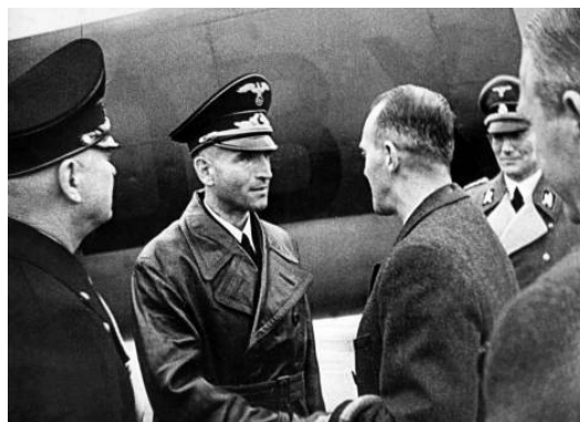
Werner Best

Men efter optøjerne herhjemme i sommeren 1943 var Best kommet i unåde hos Hitler, som mente at Best ikke havde været hårdhændet nok. Nu hang hans magt i en tynd tråd. Hvis Best kunne løse ”jødespørgsmålet”, ville han vinde Hitlers gunst og redde sin egen politiske stilling.